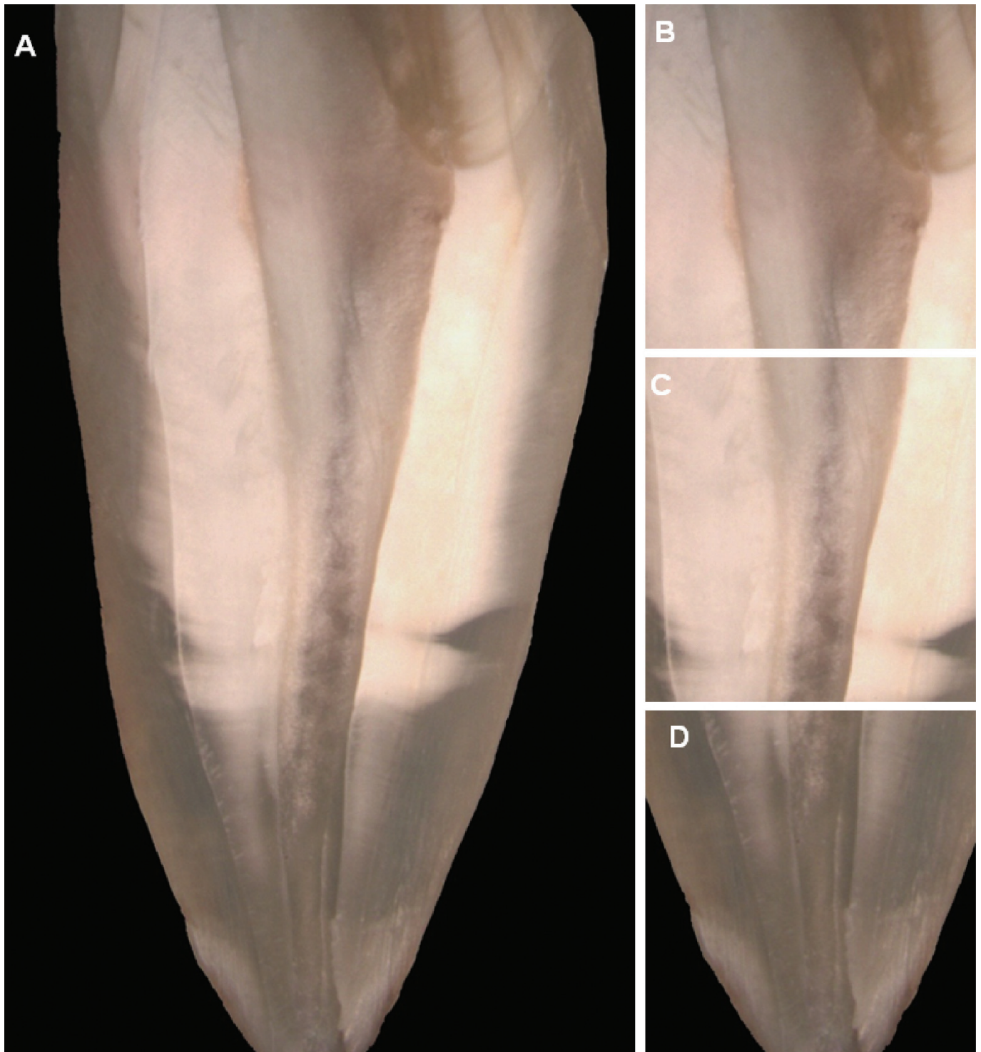
Figura 1. Grupo Controle. (A) Imagem contendo todos os terços do canal radicular, revelando a ausência total de \text{Ca(OH)}_2 (7,5 \times ). (B) Terço Cervical (20 \times ) sem vestígios de \text{Ca(OH)}_2 . (C) Terço Médio (20 \times ) sem vestígios de \text{Ca(OH)}_2 . (D) Terço Apical (20 \times ) sem vestígios de \text{Ca(OH)}_2 .