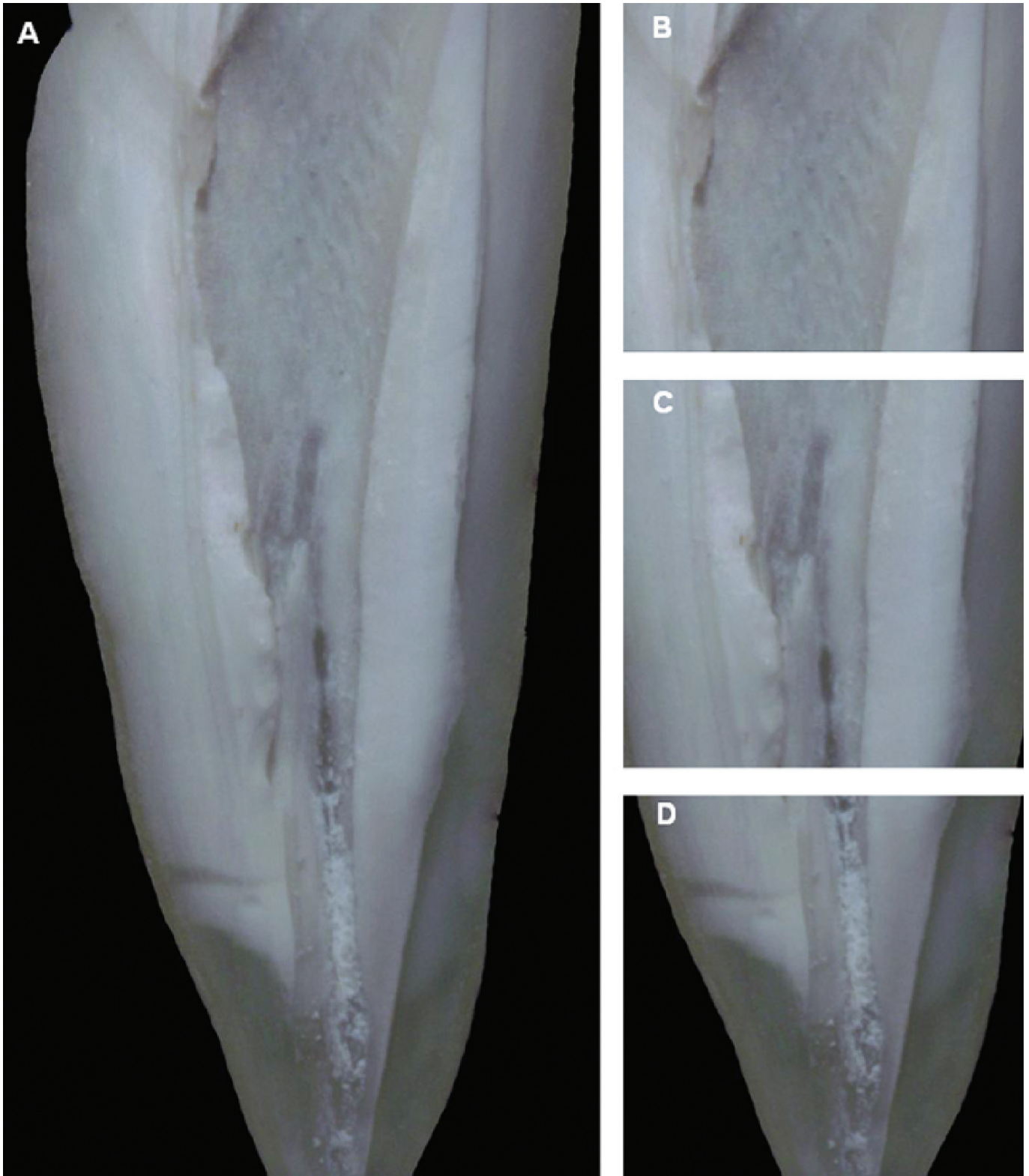
Figura 3. Grupo da Irrigação Ultrassônica Passiva. (A) Imagem contendo todos os terços do canal radicular, revelando presença de \text{Ca(OH)}_2 na região apical (7,5 \times ). (B) Terço Cervical (20 \times ) mostrando ausência de \text{Ca(OH)}_2 . (C) Terço Médio (20 \times ) revelando ausência de \text{Ca(OH)}_2 . (D) Terço Apical (20 \times ) indicando pequena quantidade de \text{Ca(OH)}_2 .

de Van der Sluis, visto que a técnica convencional associada à IUP mostrou-se mais eficiente na remoção da pasta de \text{Ca(OH)}_2 ( p < 0,05 ) do que a técnica convencional associada à irrigação final de modo manual. Entretanto, mesmo associando técnicas, em nenhum dos grupos experimentais a medicação intracanal foi completamente removida, quando comparados ao grupo controle ( p < 0,05 ).