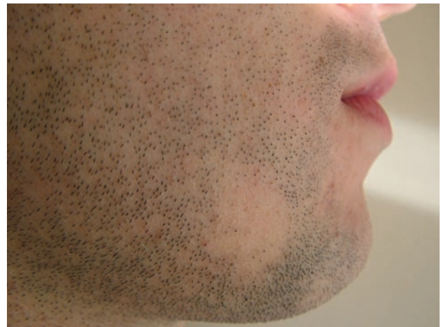
Figura 1. Área de alopecia bem demarcada na zona anterolateral da face direita.

Não são todos os pacientes que sofrem desta condição que precisam de tratamento, uma vez que na maioria dos pa-