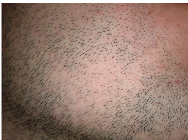
Figura 4. Pormenor do aparecimento de pelos na zona de alopecia, após dois meses da extração dos dentes inclusos.