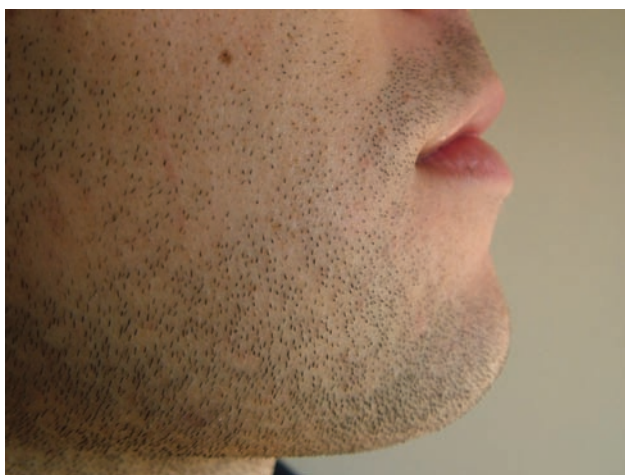
Figura 5. Fotografia da área correspondente à alopecia areata, após seis meses da extração dos dentes inclusos.

cientes o pelo volta a crescer espontaneamente. Estes casos ocorrem quando a perda de pelo é resultante de alterações naturais nas hormonas corporais ou qualquer outra razão que é geralmente temporária. 4